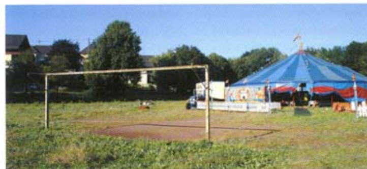
Dörflicher Fußballplatz in Troisdorf-Bergheim; In der Sommerpause schlägt dort ein kleiner Wanderzirkus seine Zelte auf – im Winter macht das Sieg-Hochwasser den Platz zeitweise unbespielbar.